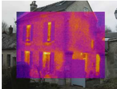
Déperditions à travers les murs non isolés